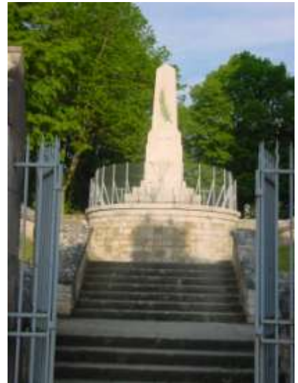
Photo 2 Monument aux morts

Traverser le jardin et prendre en face la rue des Jardins. Tourner dans le premier chemin à droite et à l'intersection suivante prendre à droite et tout de suite à gauche le chemin qui monte, continuer tout droit jusqu'au Petit Creilly. À la route prendre à gauche, continuer tout droit et prendre le premier chemin à droite (presqu'en face de la porte grillagée de la décharge de la commune).