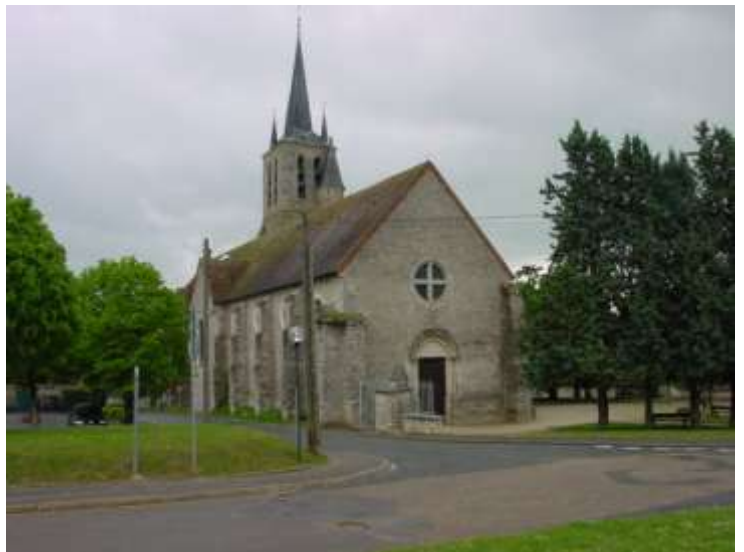
Photo 8 Église de Lorrez-le-Bocage

Puis prendre la première rue à gauche (rue du Puits aux Bérays). Arriver à la route, prendre à droite, la rue des Chesneaux. Au panneau stop ( attention DANGER ), traverser la D218, prendre le chemin en face dans la vallée de Brenouelle, puis le premier chemin à gauche en direction du clocher de l'église. Arriver à la rue des Jardins, prendre à gauche en direction de l'église (photo 8) et continuer par la rue Sainte-Anne. Retour à l'école par la rue de l'église