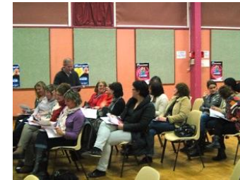
Des soirées thématiques pour les assistants maternels et les parents