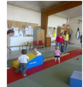
Atelier d'éveil corporel