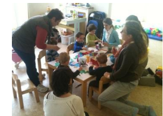
Atelier d'éveil libre